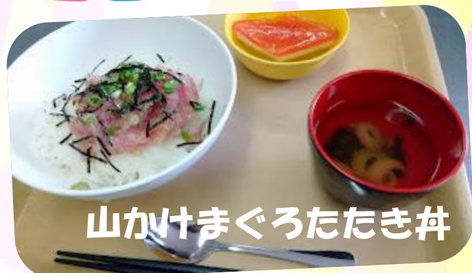
山かけまぐろたたき丼